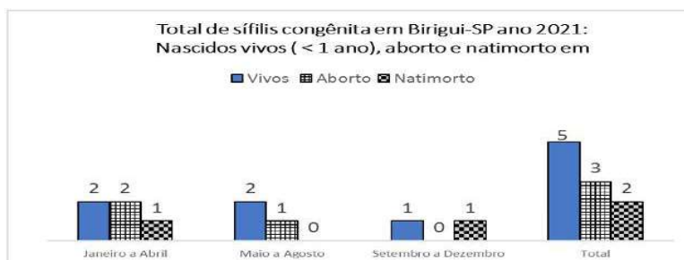
Gráfico 1 Cenário epidemiológico da sífilis congênita e em gestantes em Birigui (2021)

PREFEITURA MUNICIPAL DE BIRIGUI CNPJ 46.151.718/0001-80